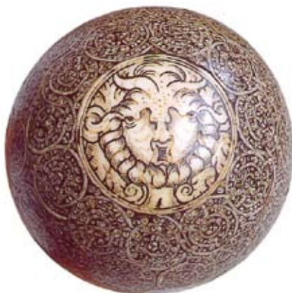
Foton ur ”Axel Wallenbergs utsökta vapensamling” av Kåa Wennberg. Fotograf Kjell Hedberg.

I övrigt hänvisas vad gäller anslagen inom medicin, ekonomi, rättsvetenskap och övriga ändamål till anslagslistan i slutet av denna skrift.